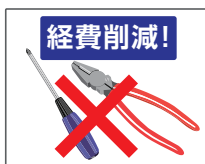
経費削減! 工事は必要ありません